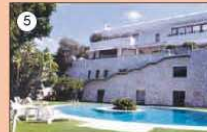
4•5 Veduta scala inox e parapetto cristallo blindato