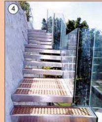
4 Scale inox e cristallo - Cagliari