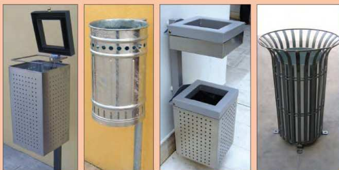
Realizzazione di cestini per rifiuti