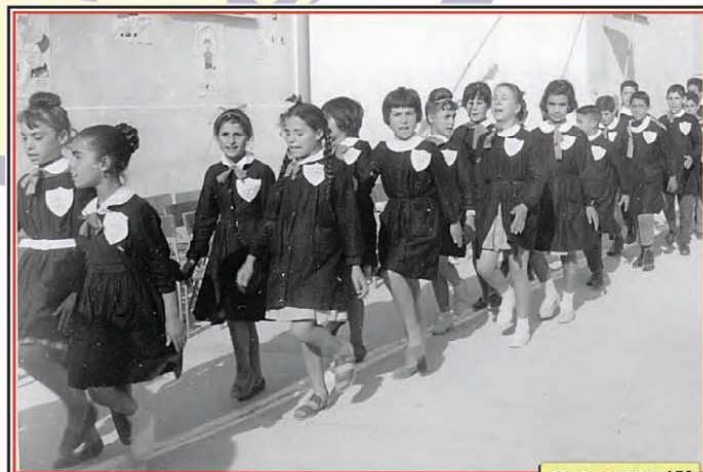
FOTOGRAFIA N. 156